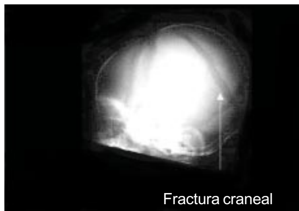
Figura 1. Fractura craneal.

Requirieron tratamiento médico 66 niños y 30, médico quirúrgico. En 87 de 96 casos la evolución